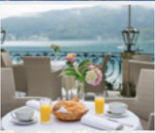
Frühstück mit Seeblick ...