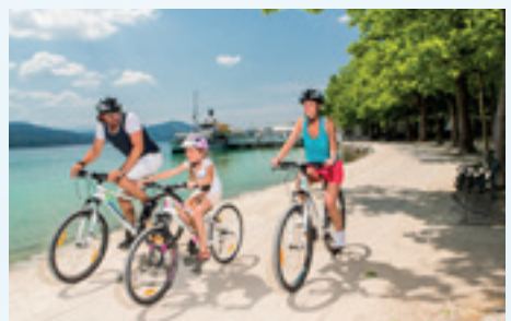
Aussichtreiche Radtouren ...