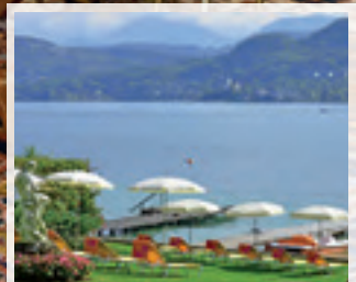
Badestrand – Hotel Dermuth & Parkvilla

Südliche Lebensfreude, kombiniert mit dezenter Eleganz, erwarten Sie in unserem Stammhaus. Sie befinden sich direkt im Zentrum von Pörschach und können nach Belieben bummeln, shoppen oder ins vielfältige Nachtleben eintauchen. Tagsüber erholen Sie sich auf dem 5.000 m 2 großen Badestrand bei der Parkvilla Wörth.