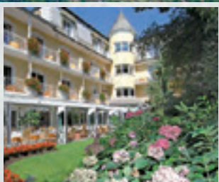
Hotel Dermuth ...