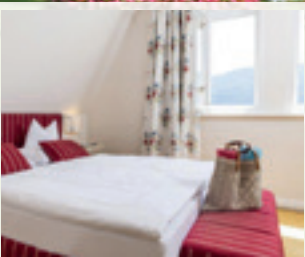
Bezauberndes Ambiente ...

Exklusiv die Lage – direkt am Würthersee inmitten einer 5.000 m 2 großen, herrlichen Parklandschaft – überzeugt durch stilvoll eingerichtete Zimmer mit jeglichem Komfort. Sie frühstücken auf der sonnigen Seeterrasse, genießen einen unbeschwerten Badetag am Strand und erleben romantische Abendstunden zu zweit oder mit guten Freunden. Sie planen Seminare, Feiern, Hochzeiten ...? Bei uns sind Sie richtig!