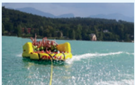
Gratis UFO-Fahrt ...