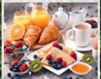
Alles für einen perfekten Start ...