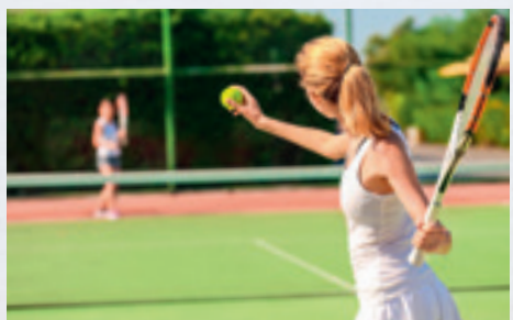
Aufschlag am Centercourt ...