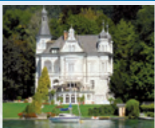
Parkvilla Wörth ...