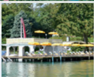
Badestrand Hotel Sonnengrund ...