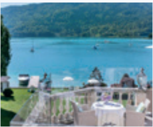
Beeindruckende Aussicht ...