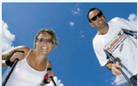
Nordic-Walking Stöcke ...