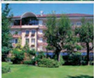
Hotel Sonnengrund ...