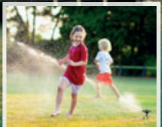
Kindererlebnisse im Garten ...

Familiär die Atmosphäre. Zentral und doch in ruhiger Lage, in einem 3.000 m 2 grünen Park mit üppigem Pflanzenwuchs, präsentiert sich das gemütliche Hotel Sonnengrund ideal für Ihren Familienurlaub. Während sich Ihre Kinder im großzügig angelegten Garten vergnügen, genießen Sie entspannt die wichtigste Mahlzeit des Tages.