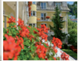
Traumhafte Blumenpracht ...