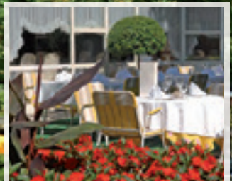
Herrliche Gartenterrasse ...