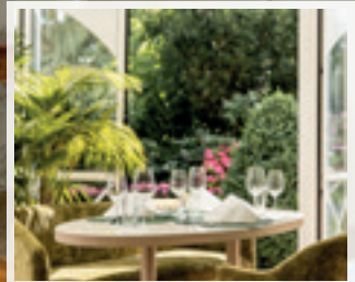
Sonniger Speisesaal ...